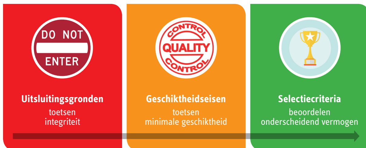
Schematische weergave proces voorselectie

Uiteraard moet de voorselectie ook aan de wet voldoen. Een voorselectie beoordeelt de geschiktheid van potentiële deelnemers, niet hun mogelijke aanbieding. De opdrachtgever kan een eerste schifting maken met zogenaamde uitsluitingsgronden en geschiktheidseisen. Uitsluitingsgronden weren niet-integere kandidaten. 4 Geschiktheidseisen dienen om ongeschikte kandidaten uit te sluiten. 5 Geschiktheidseisen zijn niet verplicht, maar zijn wel gebruikelijk. Bij voorkeur vermijdt de opdrachtgever te veel, te zware of te specifieke eisen. Dat drijft de administratieve kosten op en beperkt de mededinging. Uiteindelijk heeft de opdrachtgever minder keus. Als niemand voldoet, is de selectie mislukt. Bescheiden geschiktheidseisen leiden niet tot een noemenswaardige toename van geïnteresseerde bureaus, terwijl de opdrachtgever zo wel de kans krijgt om nieuwe bureaus te leren kennen. Dat blijkt uit de selecties van de gemeente Rotterdam.